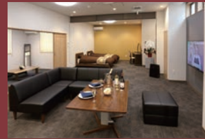
※式場によりイメージは異なります。