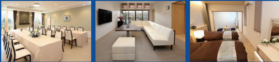
※式場によりイメージは異なります。